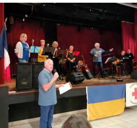
Concert donné par ChantonZensemble dont les bénéfices ont intégralement été reversés en aide à l'Ukraine.

Elle a également mis tout en œuvre pour accueillir une première famille (une maman et ses deux enfants) en mars dernier et plus récemment une jeune femme seule arrivée D'Ukraine. (Voir encadré).