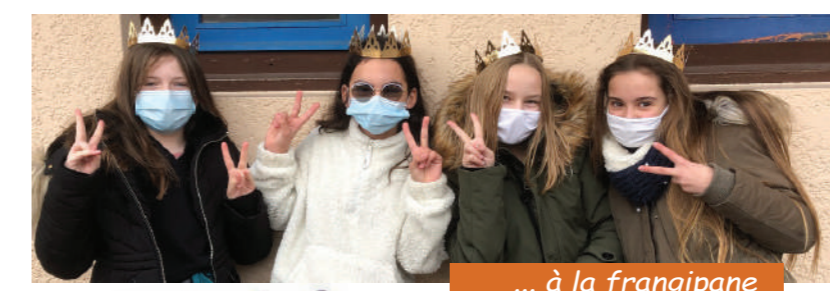
... à la frangipane