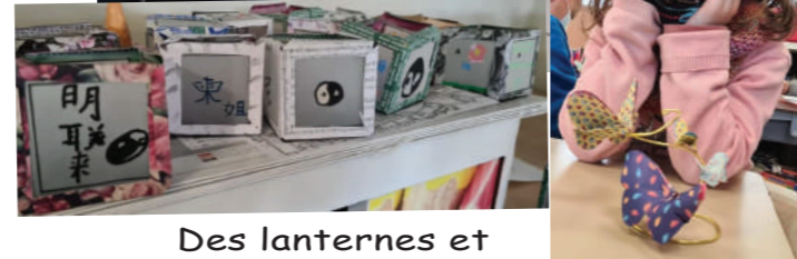
Des lanternes et des papillons en origami